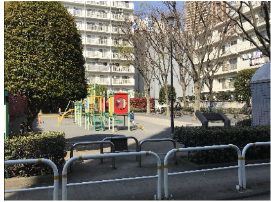
左手に公園が見えます。まだまっすぐ進みます。