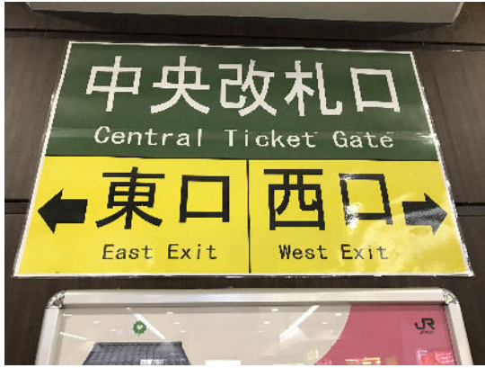
JR山手線 五反田駅 中央改札を西口に進みます。