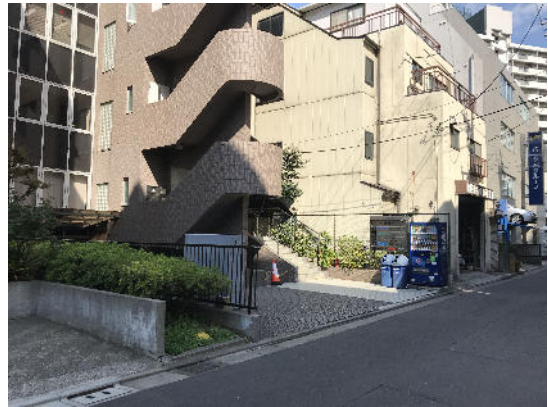
こちらの茶色の建物になります。