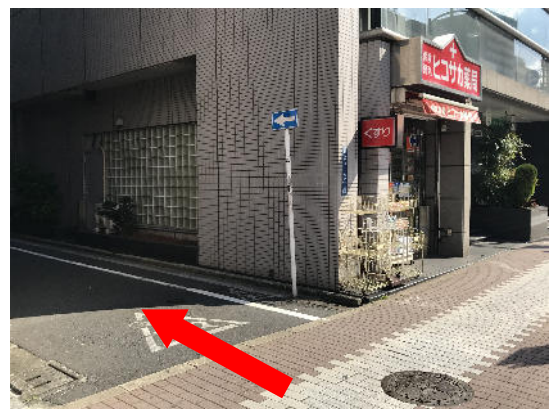
赤い看板 ヒコサカ薬局の手前を左に曲がります。