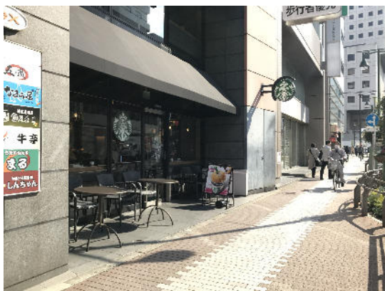
スターバックスまでまっすぐ進みます。