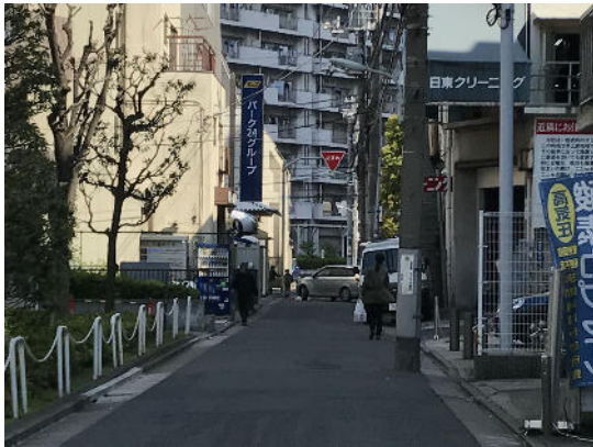
「パーク24グループ」の看板を目指します。