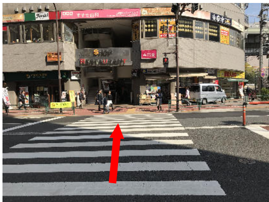
大通りの反対側に渡ります。