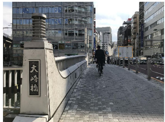
大崎橋を渡し、しばらく歩きます。