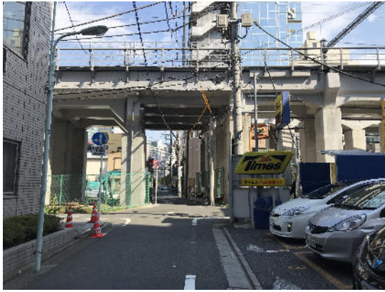
東急池上線の降下をくぐり、まっすぐ進みます。