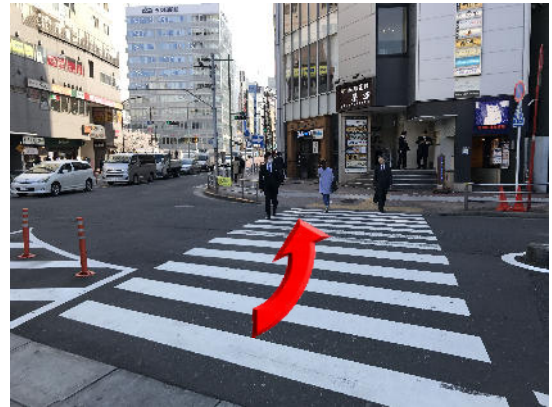
横断歩道を珈琲茶館の方に渡ります。